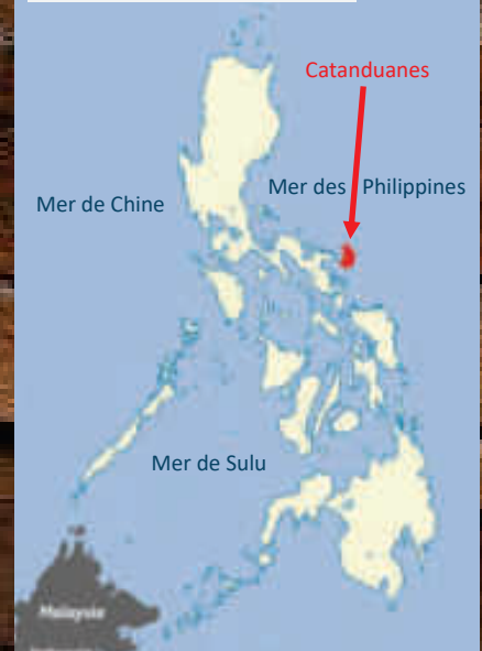
ARCHIPEL DES PHILIPPINES

Nous avons eu des discussions constructives sur la mise en œuvre future de ce programme et sa pérennité.