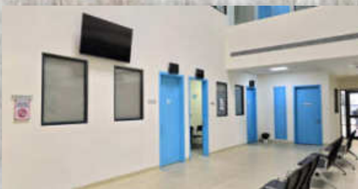
Salles de consultation pédiatrique