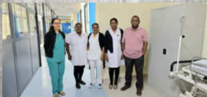
L'équipe de soignants du service de pédiatrie

Si vous souhaitez soutenir nos actions, ou parrainer un enfant pied bot, merci de nous contacter: