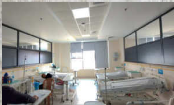
Service de pédiatrie-Chirurgie générale

A ce jour nous avons récolté la moitié de la somme, les travaux de décoration commenceront le 15 janvier, n'hésitez pas à visiter le projet sur notre page HelloAsso si vous voulez nous aider à redonner le sourire à tous ces enfants!